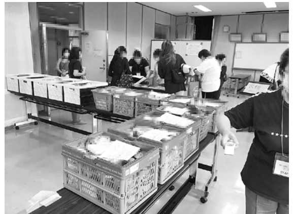
フードパントリー活動に

年3回、新型コロナウイルスの影響を受けて日常生活に困難を抱えた人々を支援する助成を行いました。フードパントリー活動や子ども食堂、地域の居場所づくり活動などを行っている団体を対象に、活動に必要な食材や感染対策に必要なアルコール消毒液、体温計やアクリル板などの購入費に対して35団体992万8,000円助成決定しました。