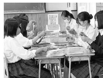
学生に協力いただきました