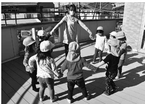
「ウッドデッキを改修しました！」