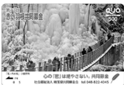
クオカードデザインに小鹿野町の風景を採用