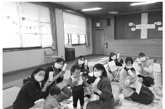
子育てサロンに参加しているママさんに

この物品寄付を、30団体に助成決定し、自立支援ホームなどの福祉施設利用者、フードパントリーや子育てサロンの利用者などを対象に配付しました。