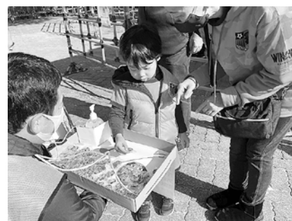
試合会場での募金風景