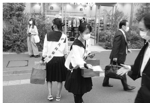
浦和駅の募金風景

県本部主催の街頭募金活動は、学生ボランティアの協力で「マスク」、「赤い羽根」、「メッセージカード」を封入した募金資材を10,000セット製作して、浦和駅、大宮駅、川口駅などで配布しました。