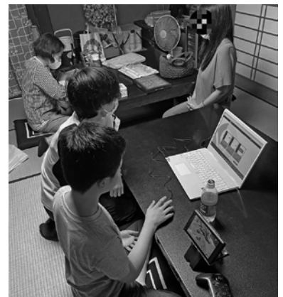
学習支援で使用するパソコンの購入に

寄付者からの意向に沿った事業に対して、助成決定を行いました。令和4年度は、各都道府県共同募金会に対し、中央共同募金会を經由して、日本中央競馬会から、地域に密着した多様な生活支援活動を応援することを目的とした寄付がありました。本県では、子ども食堂や学習支援事業などで使用する備品類などの購入費用の助成金として28件270万円を助成決定しました。