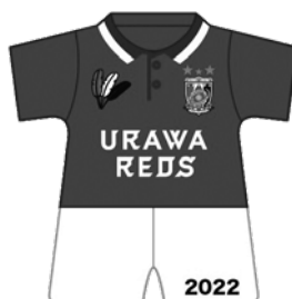
浦和レッズ コラボマグネット