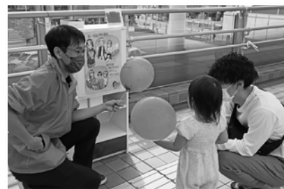
川越市の募金活動の様子