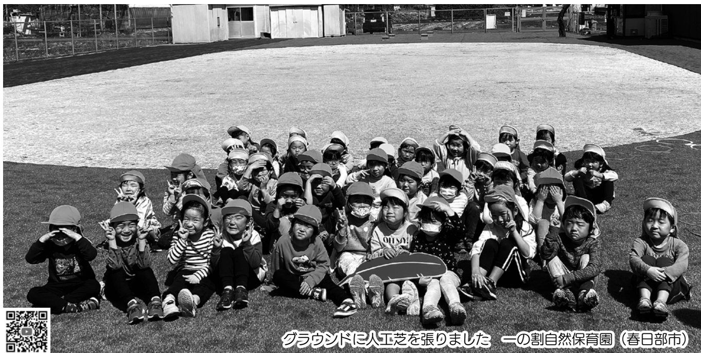
グラウンドに人工芝を張りました 一の割自然保育園 (春日部市)