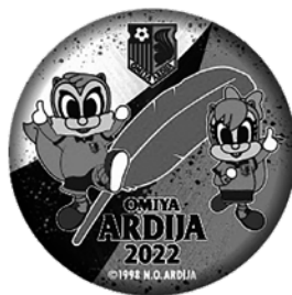
大宮アルディージャ コラボ缶バッジ