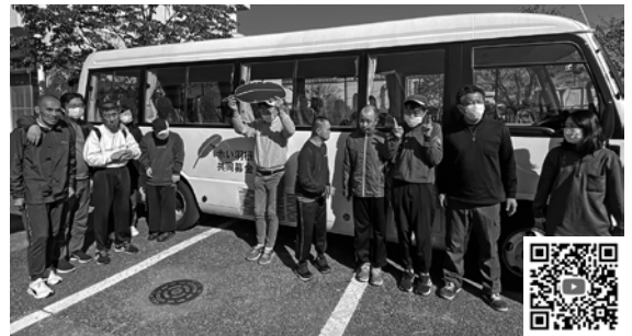
送迎用バスの購入に

令和4年度は、県内の社会福祉施設・団体から、346件8億8,721万976円の助成要望が寄せられました。要望事業に対する調査を行い、市町村社会福祉協議会が行う地域福祉事業や施設における備品整備事業など293件7億7,856万6,388円を助成決定しました。