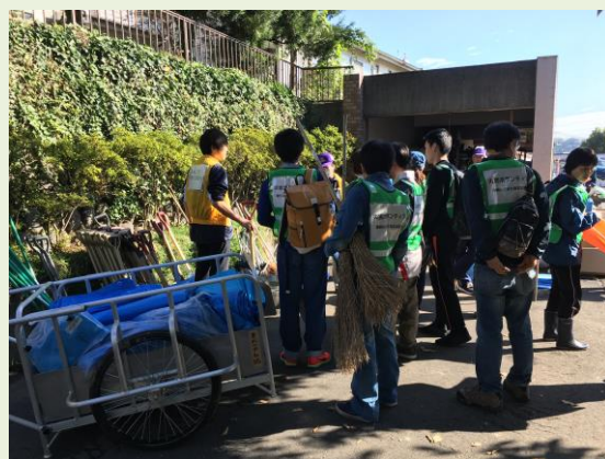
大規模災害のボランティア活動に

【お問い合わせ】 社会福祉法人埼玉県共同募金会 事務局 TEL：048-822-4045