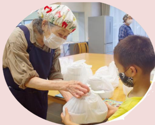
つながりをたやさないための フードパントリーやこども食堂活動に