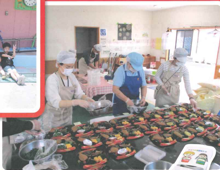
子育て世帯を対象にしたお弁当の配付に

新型コロナウイルス感染症の影響で、日常生活に支障をきたした人々がいます。 今年のNHK歳末たすけあいは、「つながりを絶やさない社会づくり」のテーマのもと 経済的に困難な人々を支える活動を積極的に支援します。