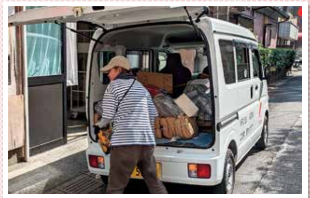
悠々クラブ(春日部市)

今回新しい車になったおかげで“いつ壊れるかわからない”という心配がなくなり、ストレスなく、安心安全に運転することができています。ドアの開閉や乗り降りもスムーズになり、利用者さんからも「前の車と違って快適だ」と評判が良いです。