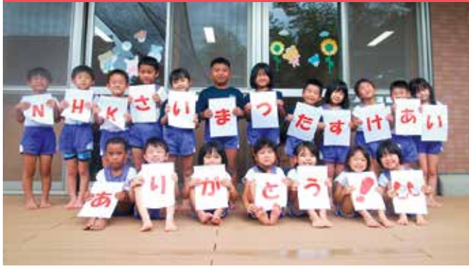
ウッドデッキの改修に