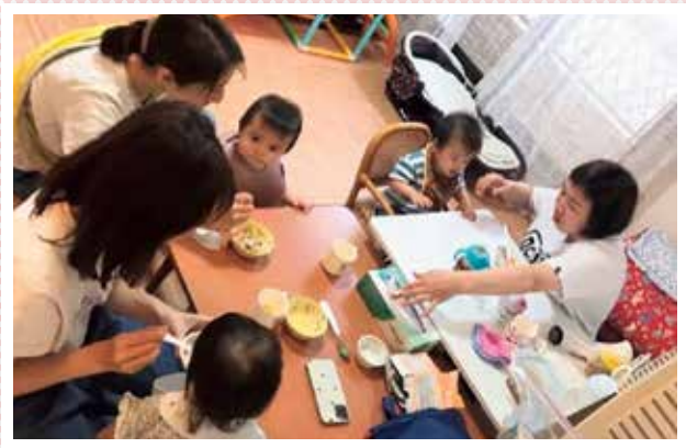
NPO法人オハナプロジェクト(新座市)

利用者の方からは、「産後ケアを受けられるプログラムは素晴らしいと思いました。身も心も癒されました。」とメッセージをいただいています。