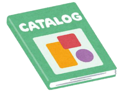
パンフレットカタログ