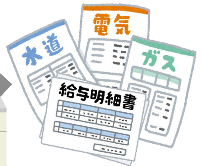
一般管理事務を行うための器材