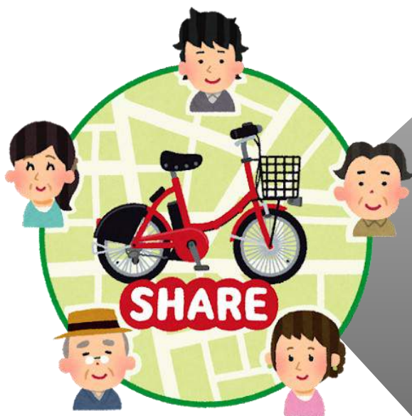
施設や他団体と共有する器材