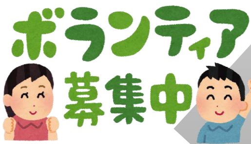
広報活動のための器材