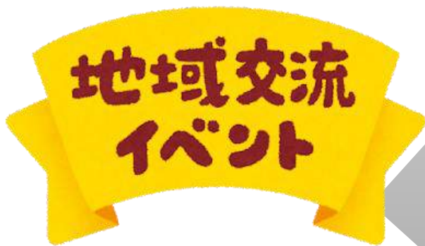
イベント開催費用