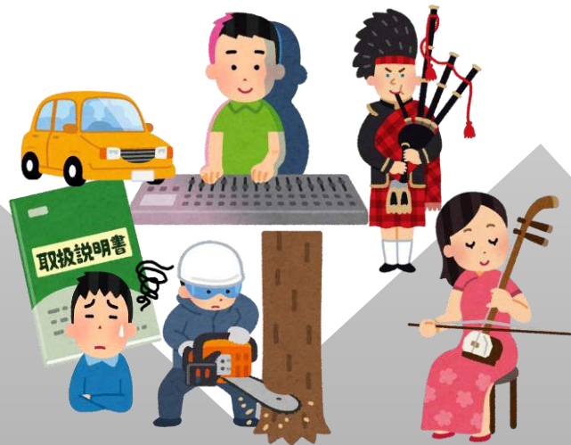
使用できる人が限定される器材・楽器等