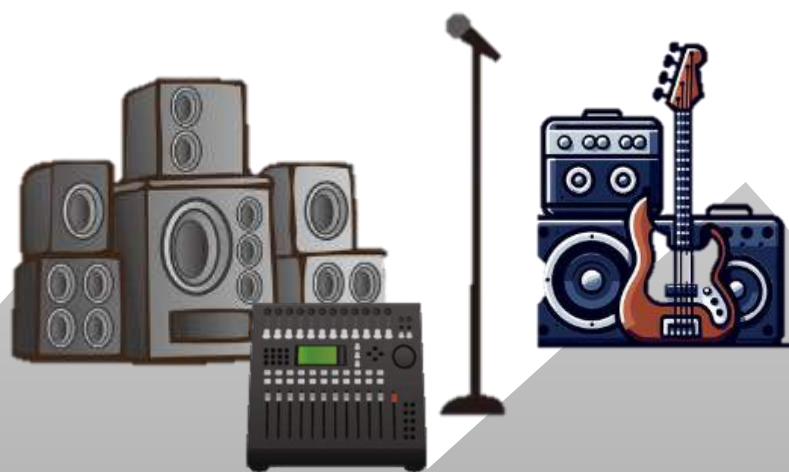
使用者が限定される楽器及び高出力アンプ・スピーカー等 その他イベント用器材