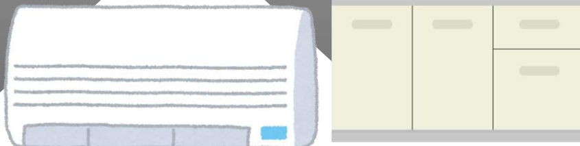
シンク等キッチン設備・洗面台・給湯器などの給排水設備及び冷暖房等空調設備等の住宅設備機器