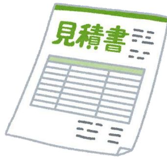
見積書 (相見積もり)