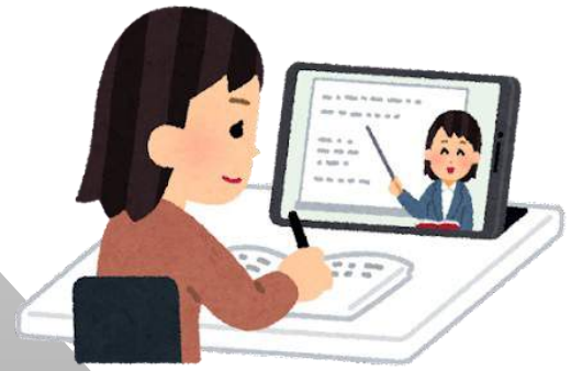
ボランティア研修・資格取得のための器材